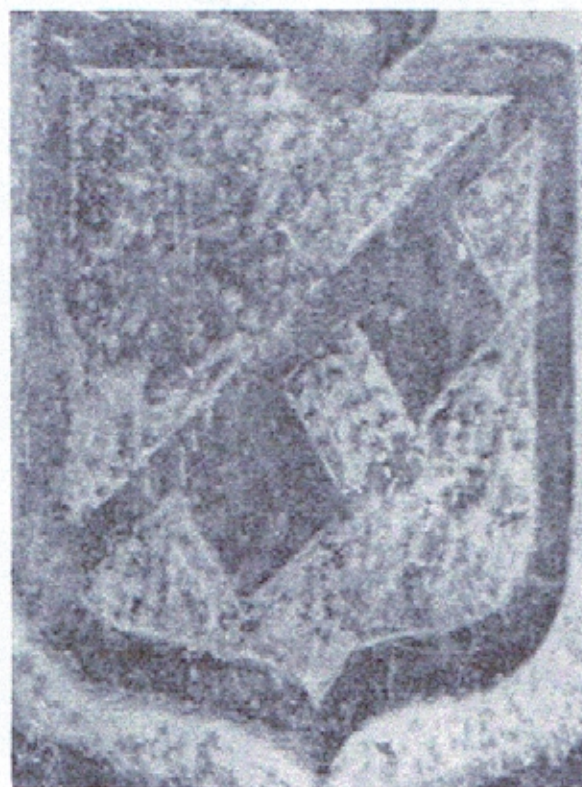
Herb Jarnołtowa i rodu włościan Von Diebes. Herb ten znajduje się na wielu płytach nagrobkowych w tutejszym kościele